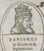
PAPISMVS in Occidente & Septentrione.